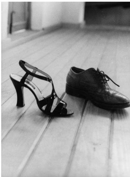
La noche de anoche , Jorge Acevedo

El Parque Hundido, como cualquier parque de una urbe, es eminentemente un centro de reunión en el que básicamente se llevan a cabo actividades para el esparcimiento familiar heterosexual, y en el que se posibilita la reproducción social de los valores y las formas de relación delineadas por el sistema cultural heterosexual. Durante los domingos el parque presenta una bulliciosa atmósfera de relajamiento caracterizada por una manifiesta actitud de los y las paseantes de ejercer su derecho al ocio, a la diversión, al juego, al encuentro familiar y al encuentro afectivo heterosexual. En este contexto de interacción y convivencia familiar heterosexual, los únicos disidentes sexuales que hacían presencia pública en el Parque Hundido eran los homosexuales de Unigay todos los domingos,