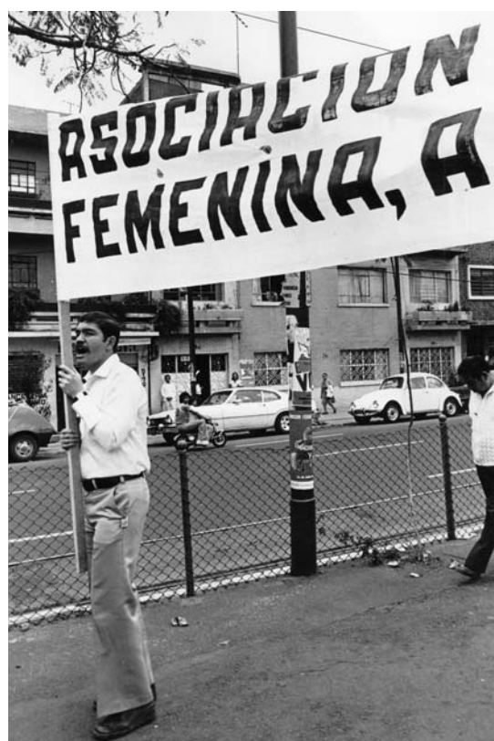
Sin título, Jorge Acevedo

social ni político en la reivindicación de la identidad gay y de la sexualidad homosexual en el contexto de la política sexual local. La importancia de la presencia pública se expresaba en el terreno de lo grupal y lo personal, es decir, en el proceso de aceptación de la identidad gay de los jóvenes y en su sentimiento de pertenencia a un grupo